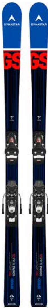
SPEED COURSE TEAM GS R21 PRO

KIT 3 DRJ03AF NX JR 7 GW B73 (FCJA046) TARIF: 269€