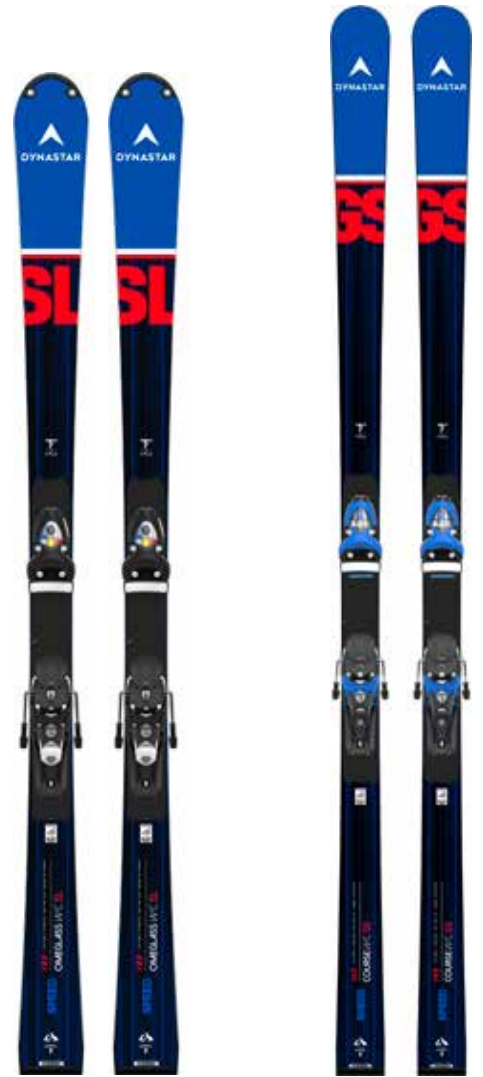
SPEED OMEGLASS WC FIS SL R22