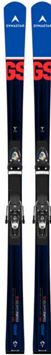
SPEED COURSE MASTER GS R22

KIT 3 DRJ04DM NX JR 7 GW B73 (FCJA046) TARIF: 269€