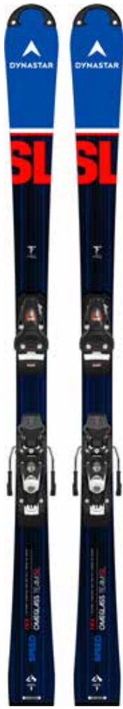
SPEED OMEGLASS TEAM SL R21 PRO

KIT 2 DRJ01DP SPX12 ROCKERACE (FCIA006) 165-170-175-182 TARIF: 529€