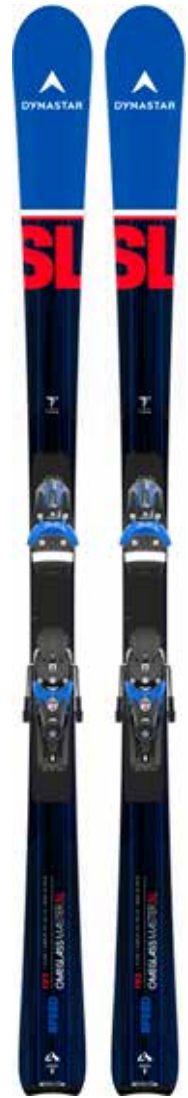
SPEED OMEGLASS MASTER SL R22

KIT 2 DRJ02HE SPX12 ROCKERACE (FCIA006) TARIF: 659€