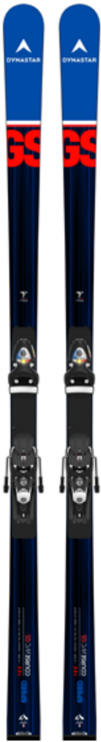
SPEED COURSE WC GS R22

Sizes | 185 | 165-170-175-182 | Sidecut | 102-65-84 | 106-65-87 | | 104-65-87 | 102-65-85 | 103-65-85 | Radius | 27m | 19m | 20m | | 23m | 25m | Weight | 4400g/p | 3800g/p | | 3900g/p | 4000g/p | 4200g/p |